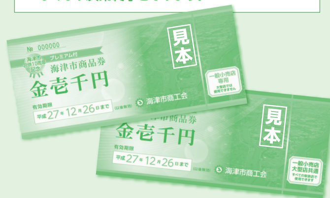
(平成27年6月27日～平成27年12月26日までの有効期限内付)

■ 販売日時 6月27日(土)・28日(日)・29日(月) AM9:00～PM4:00 なくなり次第終了となります 但し売れ残った場合は6月30日(火)より、海津市商工会館(海津町高須)でのみ販売します。(※土・日・祝日を除く) 販売時間 9:00~16:00