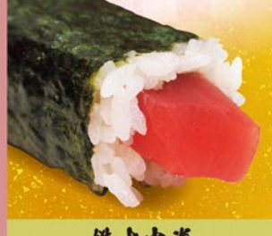
鉄火中巻 まぐろ 1本 420円 (税込)