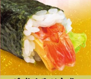
海老サラダ中巻 えび・たまご・レタス ※マヨネーズを使用しています。 1本 390円 (税込)