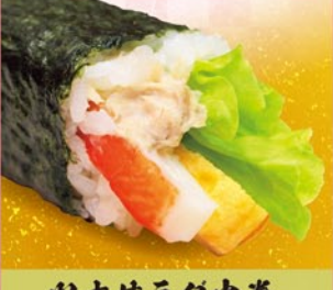
ツナサラダ中巻 ツナ・カニカマ・たまご・レタス 1本 390円 (税込)