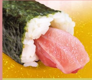
中トロ中巻 中トロ 1本 520円 (税込)