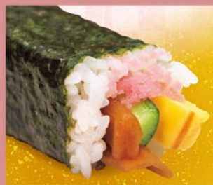
恵方中巻 かんぴょう・たまご・きゅうり 1本 390円 (税込)