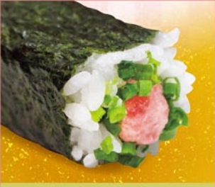
たたきマグロ中巻 たたきマグロ・ねぎ 1本 390円 (税込)