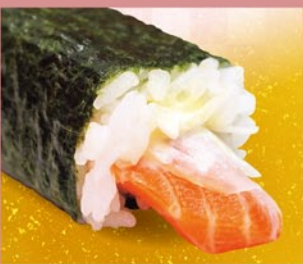
サーモン中巻 サーモン・たまねぎスライス ※マヨネーズを使用しています。 1本 390円 (税込)