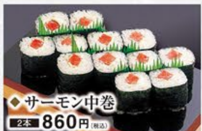
◆サーモン中巻 2本 860円(税込)