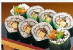
◆上太巻穴子 1本 860円(税込) ハーフ 450円(税込)