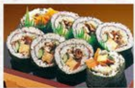
◆上太巻うなぎ 1本 1,080円(税込) ハーフ 560円(税込)