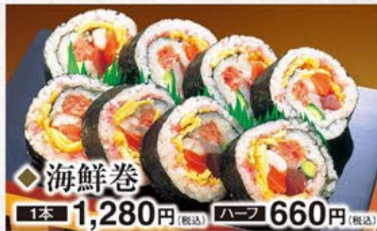
◆海鮮巻 1本 1,280円(税込) ハーフ 660円(税込)