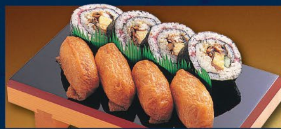
◆上助六(うなぎ) 840円(税込)