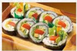
◆レタスタっぷりサーモンサラダ巻 1本 960円(税込) ハーフ 500円(税込)