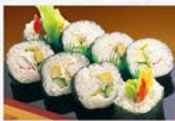
◆海老サラダ巻 1本 750円(税込)