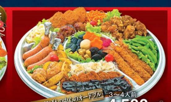
3~4人前 4,500円(税込) ◆お子様向けの揚げもの中心のオードブル ◆鶏唐揚げ ●枝豆 ●特大エビフライ ●シュウマイ ●味噌カツ ●ポテトフライ ●玉子焼き ●骨付きソーセージ ●ポテトサラダ ●エビカツ ●肉団子 ●スバケティ ●煮もの