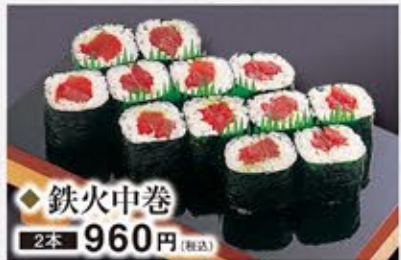
◆鉄火中巻 2本 960円(税込)