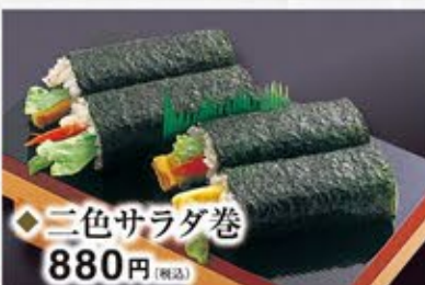
◆三色サラダ巻 2本 880円(税込)