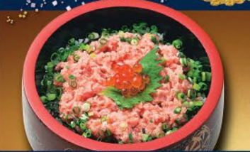
◆たたきマグロ丼 800円(税込)