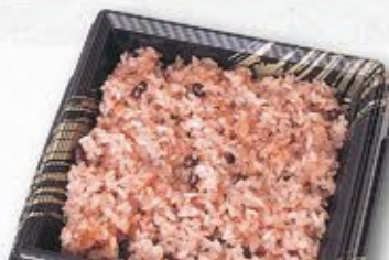
◆赤飯 250g 398円(税込) 【赤飯は前日御予約販売】 一升分(3kg) 4,800円(税込) 五合分(1.5kg) 2,400円(税込)