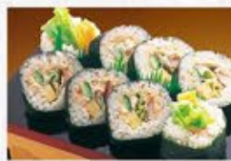
◆ツナサラダ巻 1本 700円(税込)