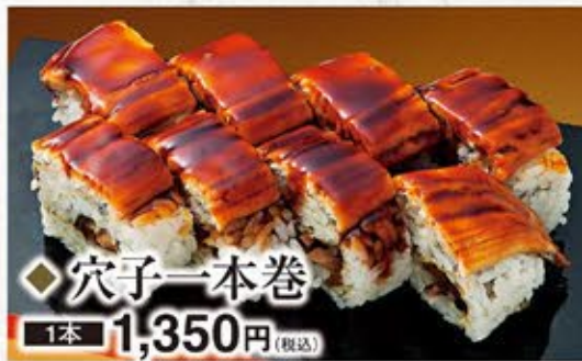
◆穴子一本巻 1本 1,350円(税込)