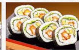
◆海老フライ巻 1本 860円(税込) ハーフ 450円(税込)