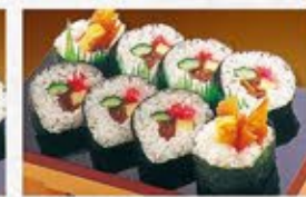
◆太巻 1本 540円(税込)