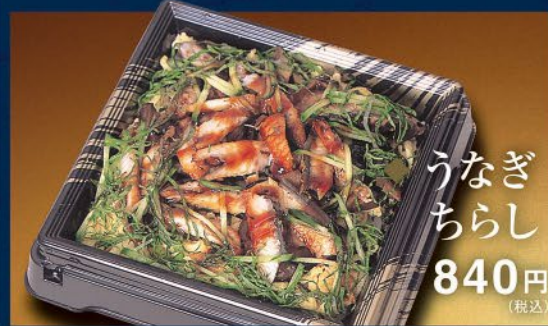
うなぎちらし 840円(税込)