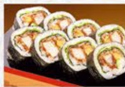
◆ロースカツ巻 1本 860円(税込) ハーフ 450円(税込)