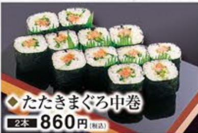
◆たたきまぐろ中巻 2本 860円(税込)