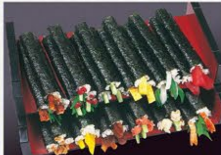
◆鉄火巻 ◆いかしそ巻 ◆海老しそ巻 ◆穴子しそ巻 170円(税込) 260円(税込)