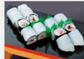
◆イカ涼味 1P 660円(税込)