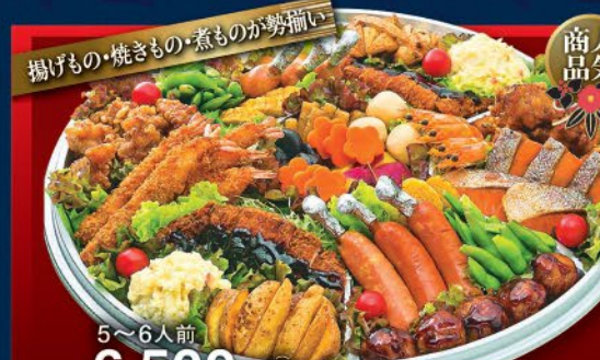
5~6人前 6,500円(税込) ◆揚げもの・焼きもの・煮ものが勢揃い ◆特大エビフライ ●ポテトフライ ●ポテトサラダ ●味噌カツ ●鶏唐揚げ ●ポイル海老 ●焼鮭 ●枝豆 ●玉子焼き ●骨付きソーセージ ●肉団子 ●シュウマイ ●煮もの