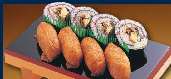
◆上助六(穴子) 730円(税込)