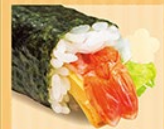
海老サラダ中巻 えび・たまご・レタス ※マヨネーズを使用しています。 1本 450円 (税込)