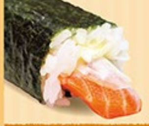
サーモン中巻 サーモン・たまねぎスライス ※マヨネーズを使用しています。 1本 430円 (税込)

中トロ中巻は商品品質確保困難のため恵方巻き販売期間の取り扱いには中止しております。ご了承下さい。