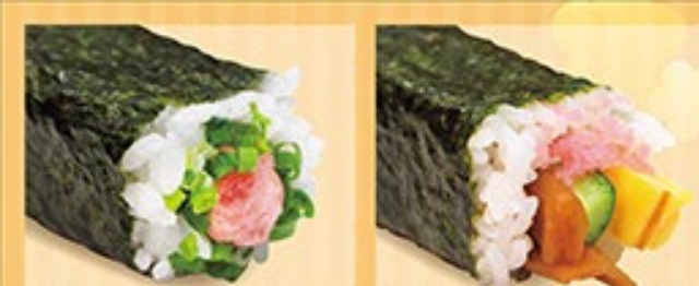
たたきマグロ中巻 たたきマグロ・ねぎ 1本 430円 (税込)