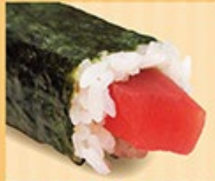
鉄火中巻 まぐろ 1本 480円 (税込)

中トロ中巻は商品品質確保困難のため恵方巻き販売期間の取り扱いには中止しております。ご了承下さい。