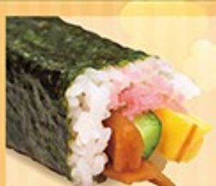
恵方中巻 かんぴょう・たまご・きゅうり 1本 460円 (税込)