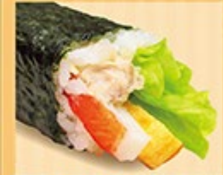
ツナサラダ中巻 ツナ・カニカマ・たまご・レタス 1本 430円 (税込)