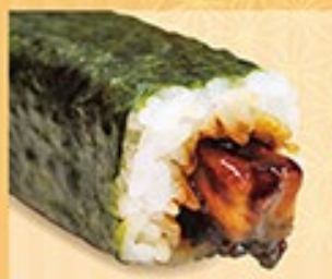
うなぎ中巻 うなぎ 1本 580円 (税込)