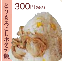
とうもろこしホタテ飯