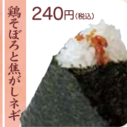
鶏そぼろと焦がしネギ