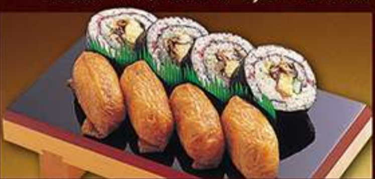
◆上助六(穴子) 980円(税込)