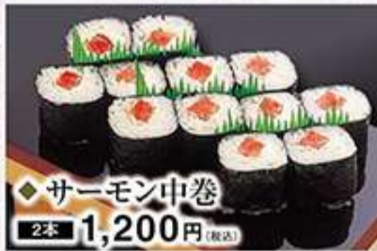
◆サーモン中巻 2本 1,200円(税込)