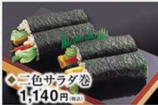
◆三色サラダ巻 1,140円(税込)