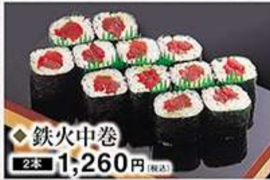
◆鉄火中巻 2本 1,260円(税込)