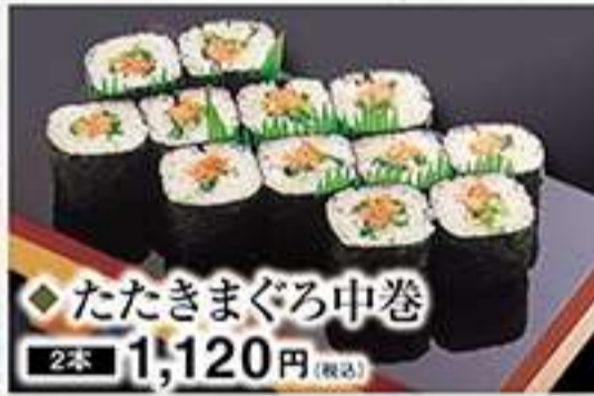
◆たたきまぐろ中巻 2本 1,120円(税込)