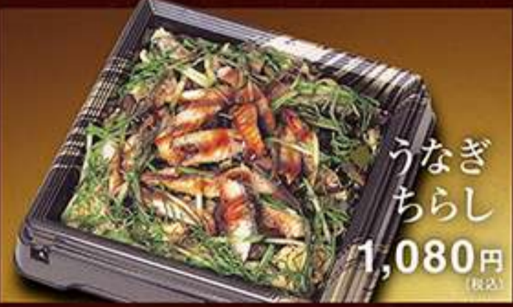
◆うなぎちらし 1,080円(税込)