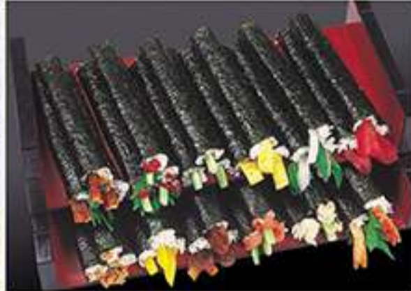
◆鉄火巻 ◆いかしそ巻 ◆海老しそ巻 ◆穴子しそ巻 330円(税込)