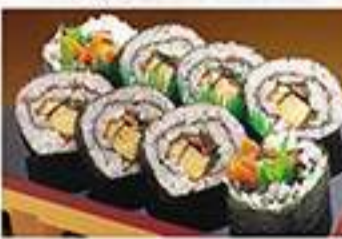
◆上太巻穴子 1本 1,280円(税込) ハーフ 660円(税込)