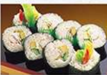
◆海老サラダ巻 1本 980円(税込)