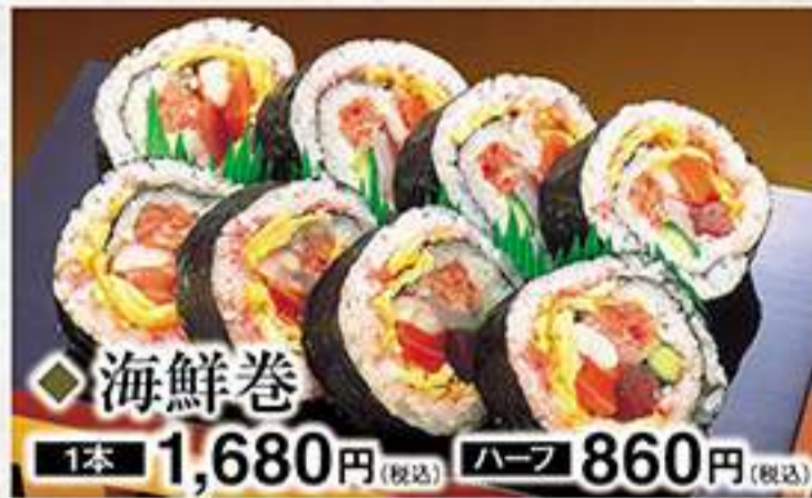
◆海鮮巻 1本 1,680円(税込) ハーフ 860円(税込)