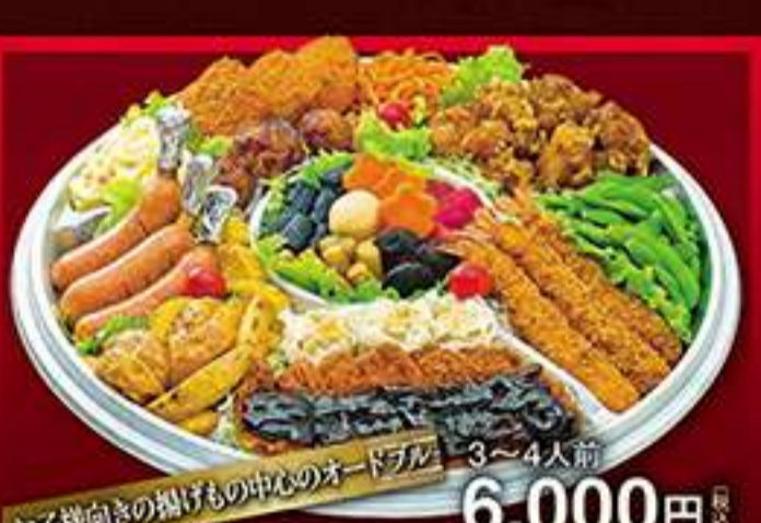
3~4人前 6,000円(税込) ◆お子様向けの揚げもの中心のオードブル◆ ◆福寿揚げ◆枝豆◆特大エビフライ◆シューマイ◆味噌カツ◆ポテトフライ◆玉子焼き◆骨付きソーセージ◆ポテトサラダ◆エビカツ◆肉団子◆スバゲティ◆栗もの