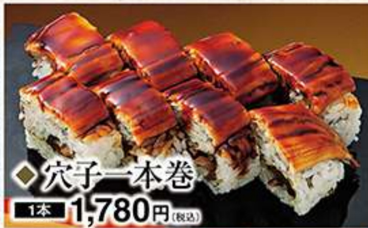
◆穴子一本巻 1本 1,780円(税込)