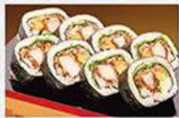
◆ロースカツ巻 1本 1,150円(税込) ハーフ 610円(税込)