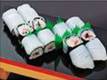
◆イカ涼味 1P 880円(税込)