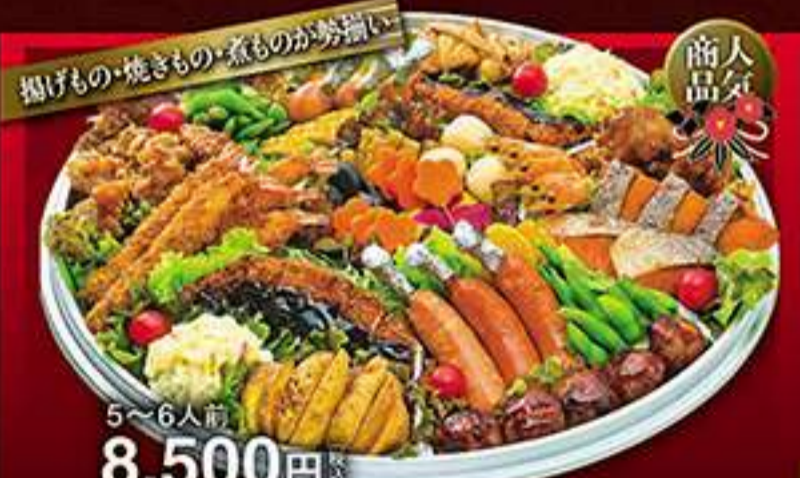
5~6人前 8,500円(税込) ◆揚げもの・焼きもの・煮ものが勢揃い◆ ◆特大エビフライ◆ポテトフライ◆ポテトサラダ◆味噌カツ◆鶏唐揚げ◆ポイル海老◆焼鮭◆枝豆◆玉子焼き◆骨付きソーセージ◆肉団子◆シューマイ◆栗もの