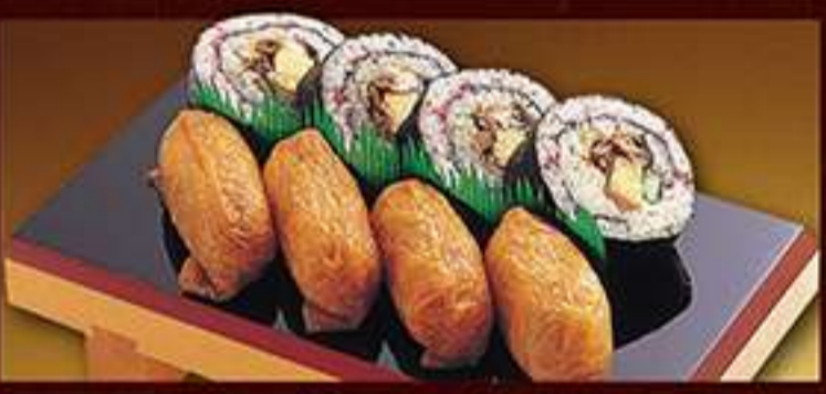
◆上助六(うなぎ) 1,085円(税込)