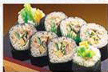
◆ツナサラダ巻 1本 900円(税込)