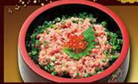
◆たたきマグロ丼 1,100円(税込)