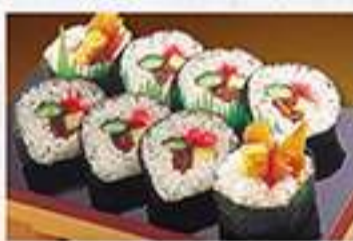
◆太巻 1本 750円(税込)