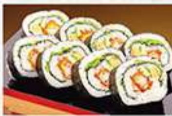
◆海老フライ巻 1本 1,150円(税込) ハーフ 610円(税込)