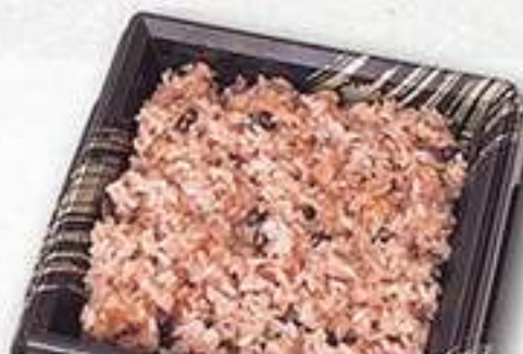
◆赤飯 250g 540円(税込) 【赤飯は前日御予約販売】 一升分(3kg) 6,480円(税込) 五合分(1.6kg) 3,240円(税込)