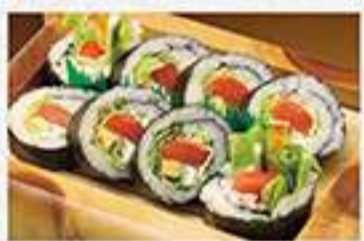
◆レタスタっぷりサーモンサラダ巻 1本 1,480円(税込) ハーフ 760円(税込)