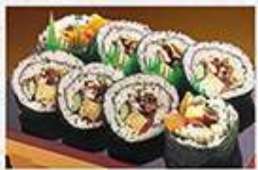
◆上太巻うなぎ 1本 1,450円(税込) ハーフ 745円(税込)